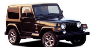
Jeep - SUV