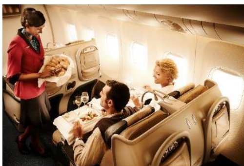
First & Business Class