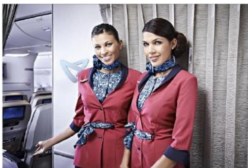
Herzlich willkommen an Bord

Wir bieten Ihnen modernste Flugzeuge mit besten Flugkomfort. Mit ausgewählten Flugpartnern reisen Sie zuverlässig- und bequem an Ihr Reiseziel. Sie haben die Wahl zwischen Flug- Klassen wie die edle First Class, die bevorzugte Business Class, die Komfortable Premium Economy Class oder die preiswerte Economy Klasse. Es erwartet Sie ein interessantes Audio-, TV- und Musik Programm. Auf dem Flug werden feine Speisen und Getränken serviert. Genießen Sie den zuvorkommenden Bord Service. Rund um den Globus bieten wir optimale Verbindungen-und Flugpreise mit sorgfältig ausgewählten Flug Partnern. Wir freuen uns Sie an Bord herzlich zu begrüßen.