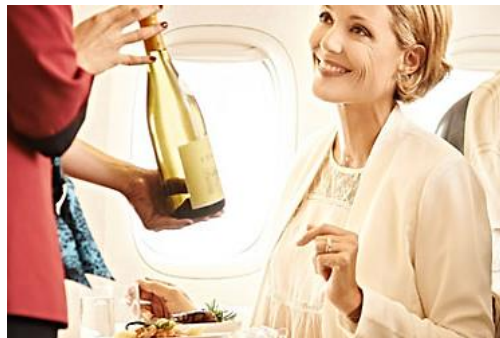
Premium Economy Class Service