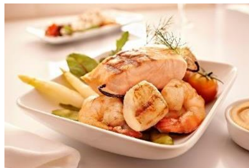
First & Business Class Service