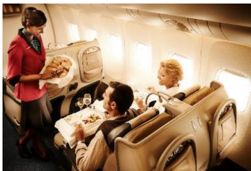
First & Business Class