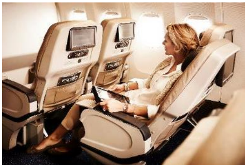
Premium Economy Class