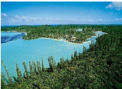
Nouvelle Calédonie, Oro Aerial

Unsere Experten freuen sich auf Ihren Reisewunsch.