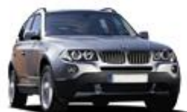
SUV Sport Wagen & Jeeps