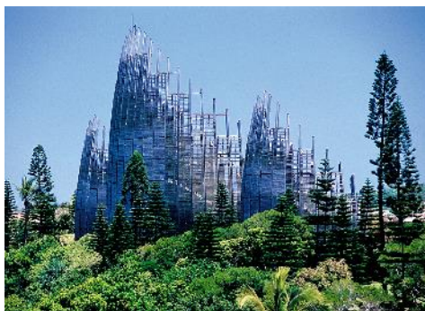
Nouvelle Calédonie, Tjibaou