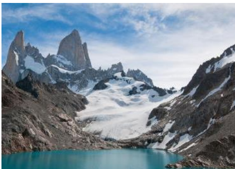
Chile Tourism © Partner of World-Travel.net