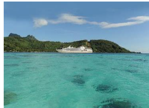
Le Ponant © Cruise- Ship - Le Soleal