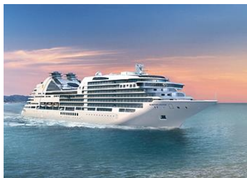
Seaborn © Cruise- Ship - Ovation

Wir freuen uns Sie an Bord herzlich zu begrüßen.