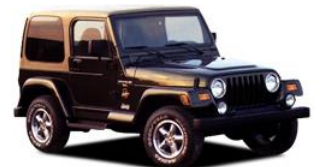
Jeep - SUV