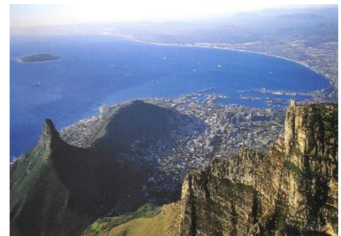
Südafrika- Kapstadt