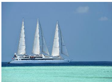
Le Ponant