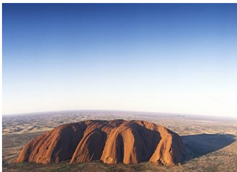
Australia – Northern Territory