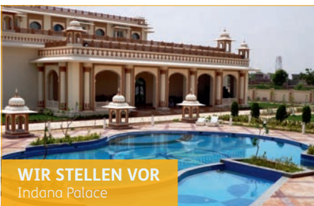
WIR STELLEN VOR Indana Palace

Fühlen Sie sich einmal wie ein Maharadscha im luxuriösen Indana Hotel in Jodhpur. Aufgrund der eindrucksvollen Architektur mit seinen Jaali-Werken, den Kuppeln und Bögen und der luxuriösen Inneneinrichtung, erinnert das Hotel an einen indischen Palast. Entspannen Sie sich im luxuriösen Spa oder genießen Sie die kulinarischen Highlights im „Anghiti“ Restaurant.